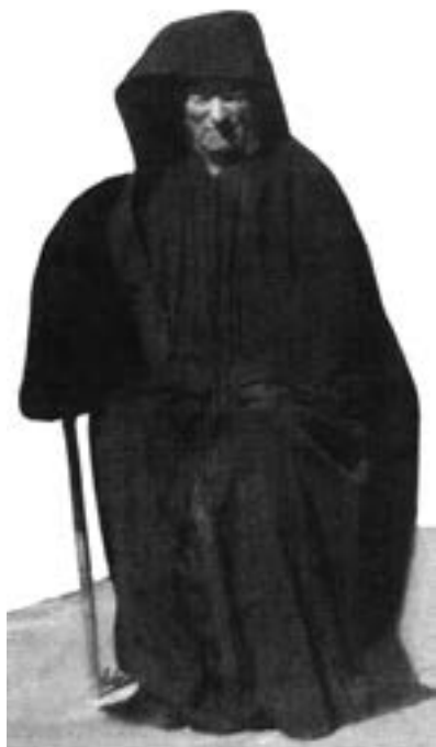
Sfântul Nichifor, monah în Hios.