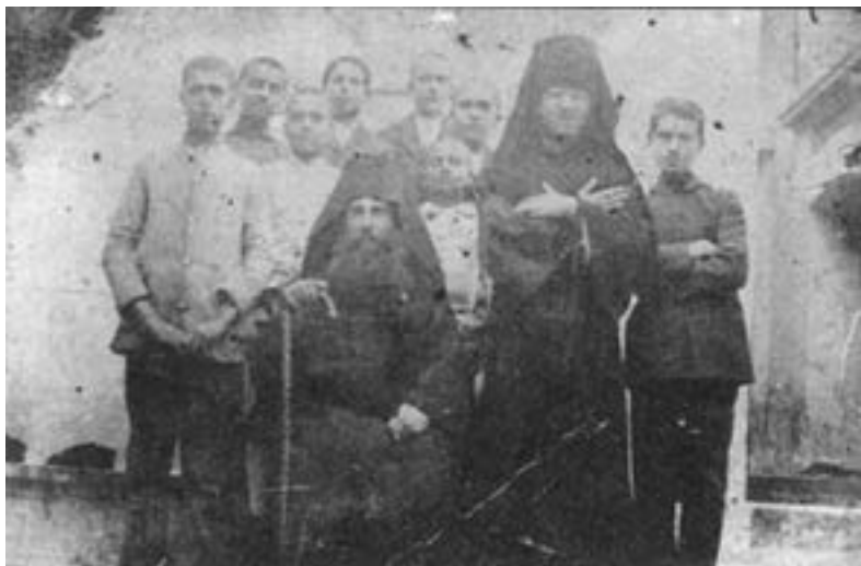
Sfântul Antim (stânga) și Sfântul Nichifor (dreapta) împreună cu alți bolnavi la leprozeria din Hios.