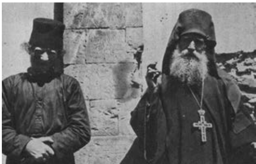
Sfântul Nichifor (stânga) și Sfântul Antim (dreapta) la leprozeria din Hios.